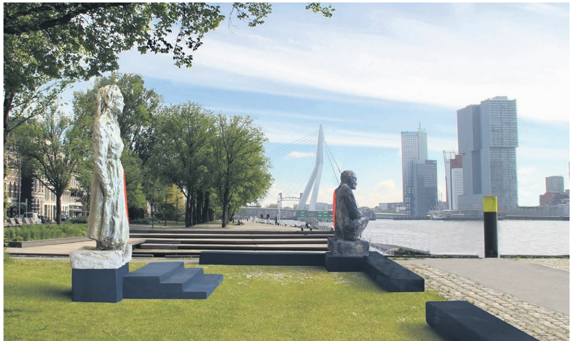
Artistieke impressie van het Razzia Monument Rotterdam aan de Parkkade te Rotterdam.

De vrouw symboliseert alle familieleden die achterbleven en af moesten wachten óf hun zonen of geliefden terug zouden keren, en zo ja, wanneer. De man staat voor alle mannen en jongens die afgevoerd werden. De emotionele kracht van het beeld is groot: je voelt en ziet de hartverscheurende pijn van de achterblijvers en de wanhoop van de gedeporteerden. Ondanks hun